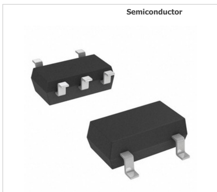
Imaginea poate fi reprezentată. Vedeți specificațiile pentru detalii despre produs.